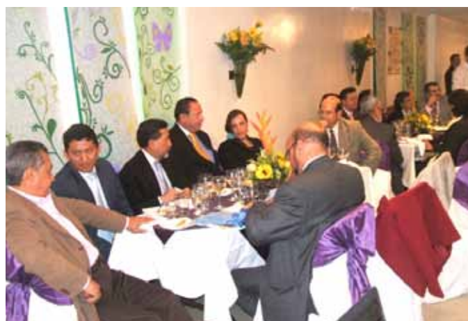
Inauguração da Coporación VIDA Bogotá – Março 2010