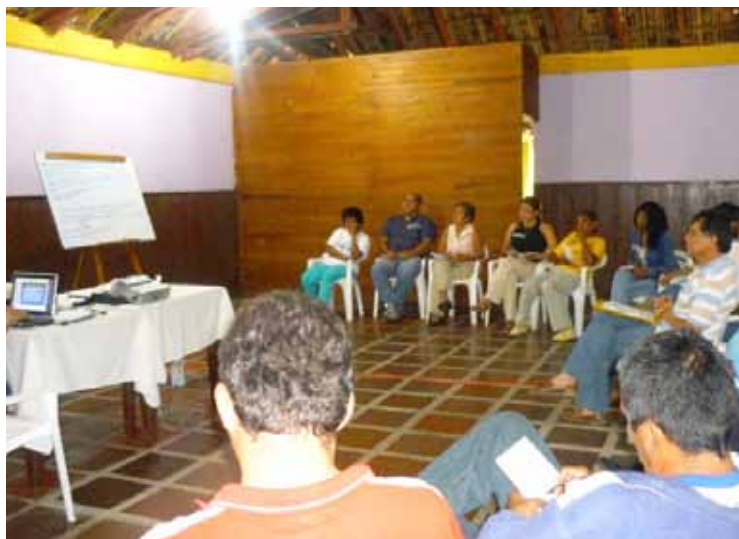
Jornadas e formação “Sol del Patía”, El Bordo, Cauca

Também com a visão de converter-se em geradora de processos sociais com a população vulnerável. A inauguração contou com a presença de autoridades governamentais de índole nacional, regional e municipal.