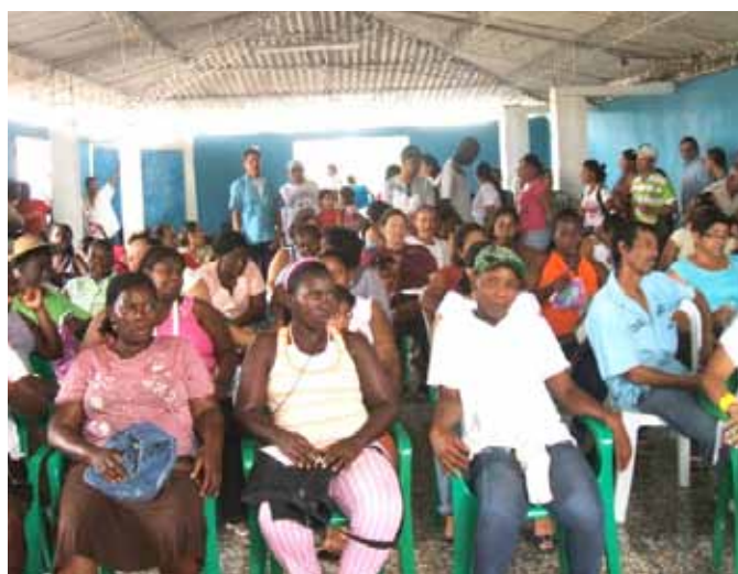
Jornadas de formação “Luz de Esperanza” Tuluá, Vale do Cauca