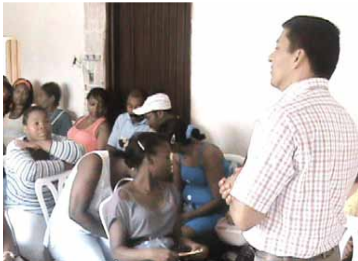
Jornadas de formação Cali, Vale do Cauca

São aproximadamente 750 famílias que se instalaram na zona de Alfonso López e do Distrito de Agua Blanca na cidade de Cali, a quem a Corporación VIDA apoiou com processos organizativos, a fim de fortalecer as suas capacidades para a criação de processos e projectos que lhes permitam criar rendimentos para a manutenção dos associados.