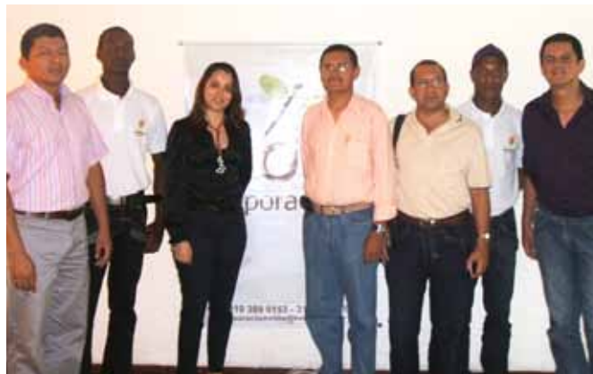
Certificação outorgada por Acção Social, Santiago de Cali, Vale Del Cauca.

Estamos integrados na rede de Organizações da Sociedade Civil do programa mundial VNU da Organização das Nações Unidas, como participantes activos para o objectivo da paz e desenvolvimento em todo o mundo através do Voluntariado.