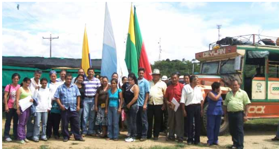
Jornadas de formação "Asoproví" Pasantía – Zarzal, Vale da Cauca

Associação de habitação formada por 40 famílias da área rural do município de Bugalagrande. Corporación VIDA fortaleceu Asorpovi com programas de formação solidária e elaboração do projecto de casa com o correspondente acompanhamento.