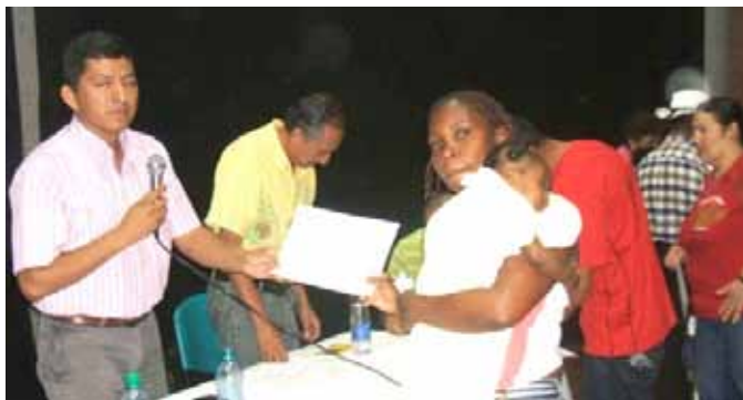
Remise de diplômes en économie solidaire à Tuluá, Valle del Cauca