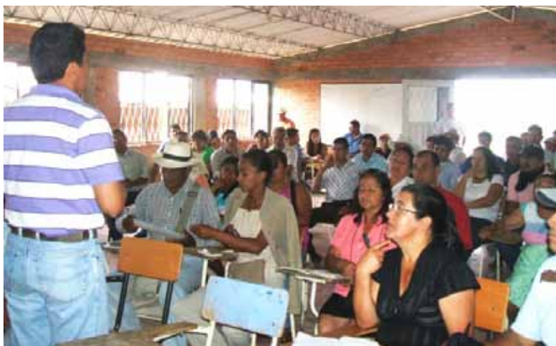
Journée de formation en zone rurale dans le massif colombien

Logo de la banque fourni par Corporación VIDA