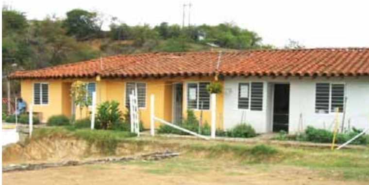
Modèle solidaire de logement "Asovina" à Zarzal, Valle del Cauca

Lieu : Zarzal Couverture : Valle del Cauca Bénéficiaires : 122 familles