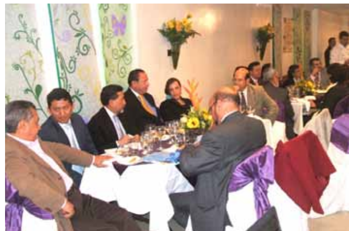
Lancement de Corporación VIDA à Bogotá en mars 2010