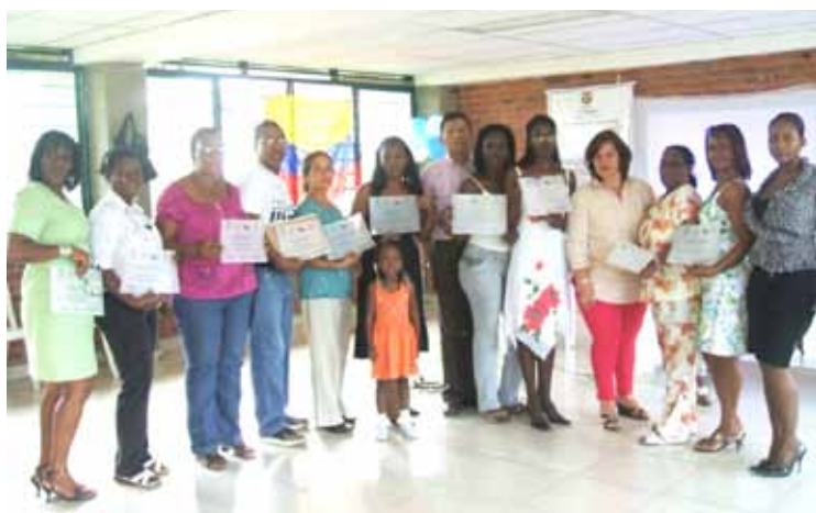
Cérémonie de remise des diplômes en Economie Solidaire à Cali, Valle del Cauca

Lieu : Cali et Tumaco Couverture : Valle – Nariño Bénéficiaires : 170 familles