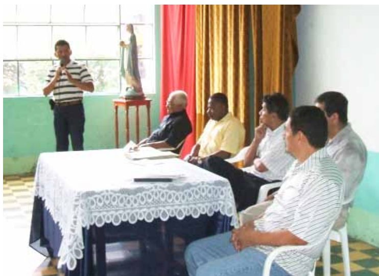
Inauguration d' "Asomundi" à Caloto, Cauca.