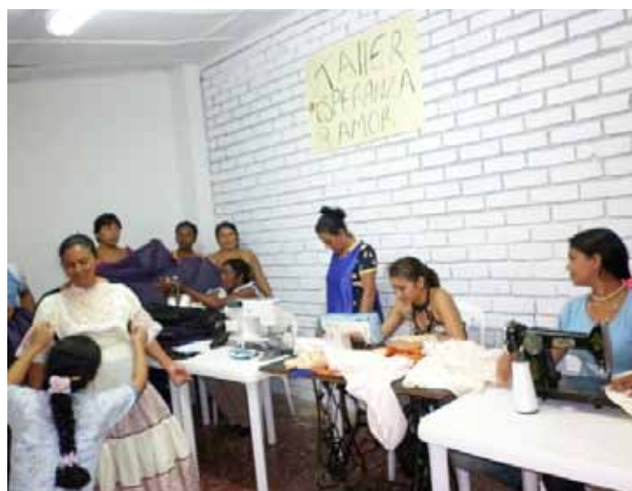
Don de tissus et atelier de confection Mères chefs de famille El Bordo, Cauca

La distribution de trois mille mètres de tissus de différentes texture et qualité s'est fait au fur et a mesure, alors que se tenait dans le même temps un programme de formation gratuite pour apprendre aux bénéficiaires comment confectionner des vêtements ordinaires typiques.