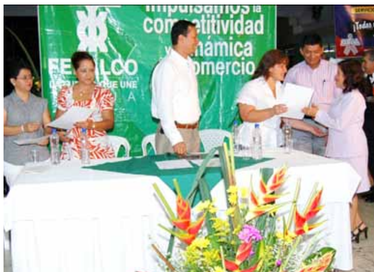
Cérémonie de remise des diplômes aux "Femmes Epargnantes" Tuluá, Valle del Cauca