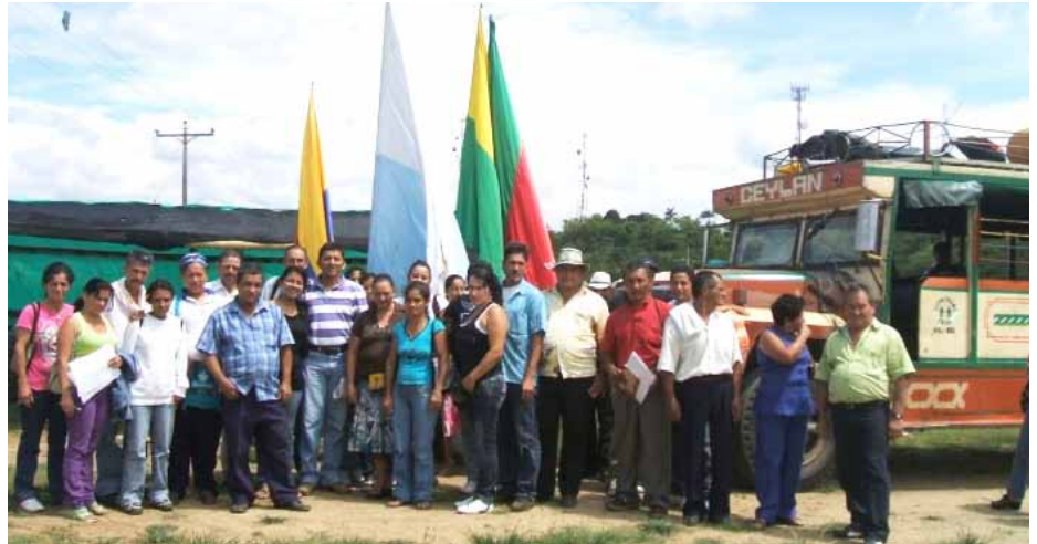
Journée de formation "ASOPROVI", stage à Zarzal, Valle del Cauca

ASOPROVI est une association de quartier fondée par 40 familles des alentours de la commune rurale de Bugalagrande. Corporación VIDA a soutenu ASOPROVI en accompagnant des programmes de formation solidaire et d'élaboration de projets de logement.