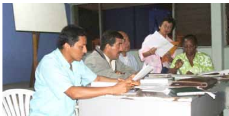
Assemblée Générale de Crédits Unis du Cauca à Popayán, Cauca

Cette organisation solidaire a été mise en place avec des anciens fonctionnaires de l’ex Caisse Agricole. Elle a vu le jour avec la volonté d’améliorer des conditions de vie de ses membres qui étaient en grande majorité sans emploi. L’idée était de mettre en place des projets générateurs de revenus durables financés par Crédits Unis.