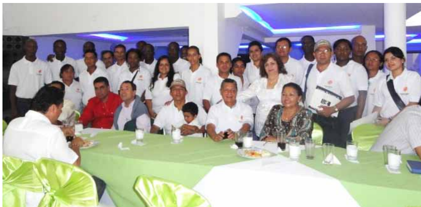
Lancement de “Nuevo Horizonte” Florida, Valle del Cauca le 28 juin 2010

Logo de l'organisation fourni par Corporación VIDA