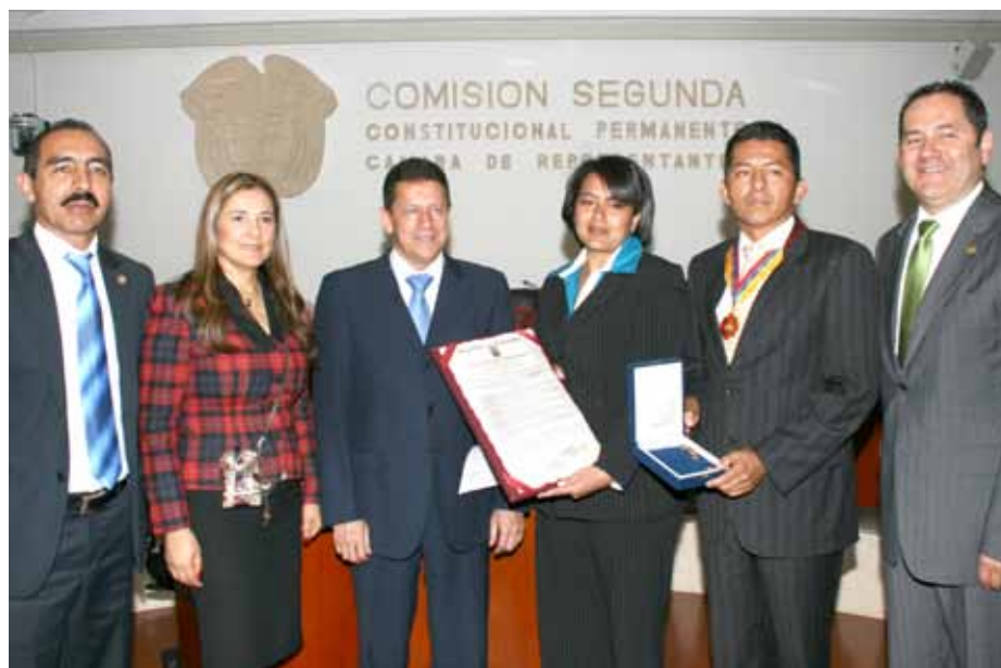
Décoration "Ordre Dignité et Patrie" décernée par le Congrès de la République de Colombie.