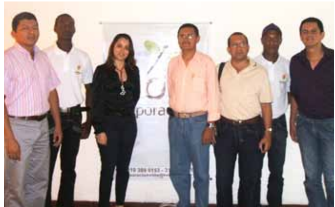
Certificat décerné pour Action Sociale Santiago de Cali – Valle del Cauca

Nous faisons partie du réseau d'Organisations Non Gouvernementales du programme mondial VNU de l'Organisation des Nations Unies en tant que participant actif à la promotion de la paix et du développement dans le monde entier sur le mode du volontariat.