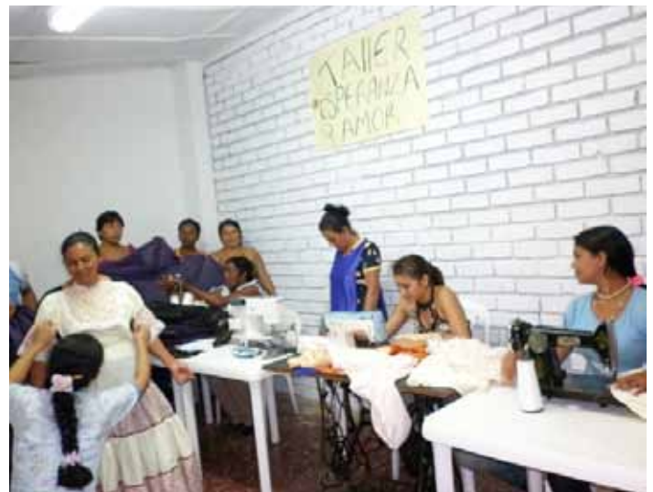
Spende von Geweben und Bekleidungsgeschäft Alleinerziehende Mütter. El Bordo, Cauca

Die Lieferung von drei tausend Metern Gewebe mit verschiedenen Beschaffenheiten und Qualitäten kann allmählich erfolgen, da sie einen verwiesenen Trainingskurs entwickeln, in dem die Begünstigten sie in freiem, typische Kostüme zu entwickeln lernten.