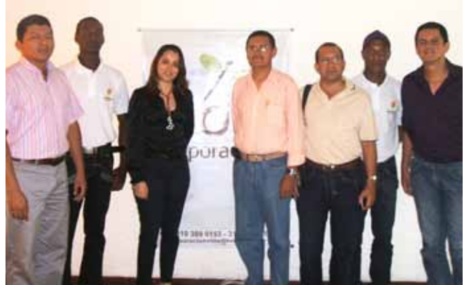
Zertifizierung durch Social Action Santiago de Cali, Valle del Cauca

Wir sind im Netzwerk der Organisationen der Zivilgesellschaft die UNV-Welt der Vereinten Nationen, als aktive Teilnehmer für die Verwirklichung von Frieden und Entwicklung weltweit durch ehrenamtliche Arbeit enthalten.