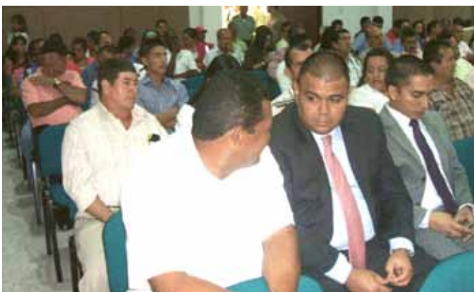
Branchenführern der regionalen und nationalen Solidarität und Regierung Sektor besuchten die Veranstaltung