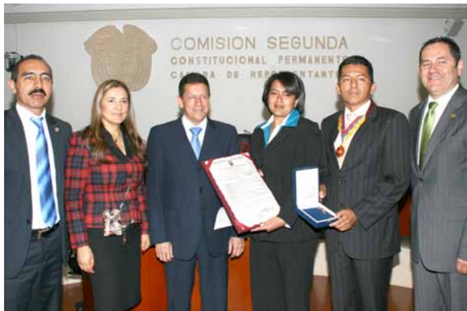
Dekoration “Ordnung Würde und Vaterland” von vergebener Kongress der Republik Kolumbien