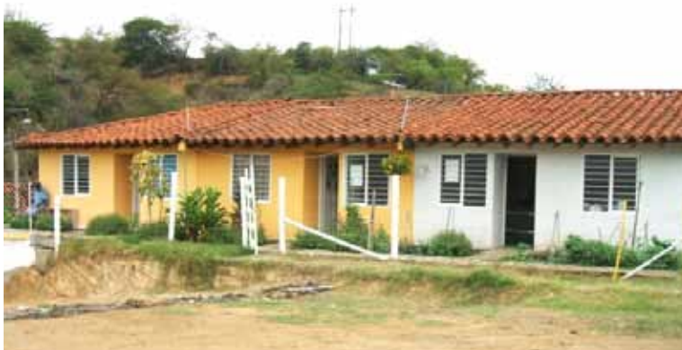
Gemeinsames Modell Solidarität der Wohnung "Asovina" Zarzal, Modell Valle Del Cauca

Das Modell umfasst 72 M2 gebaut. Wenn es im Bau, es kostet $9.800.000, $10.500.000 abgeschlossen oder fertig gestellt und eingerichtet 15 $. Millionen. (Preis 2010)