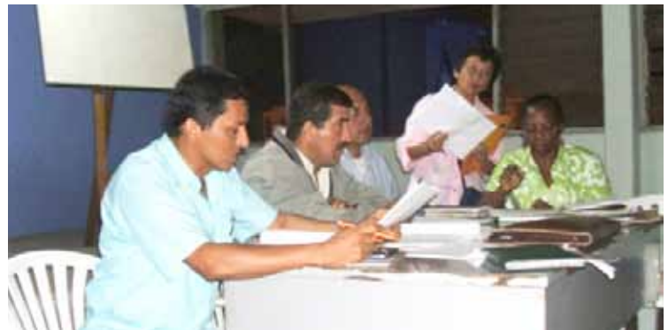
Assembly Crediunidos Cauca

Solidarity Organisation gegründet mit dem ehemaligen Beamten der ehemalige Caja Agraria. Er wurde mit dem Ziel, einen Beitrag geboren die Verbesserung der Lebensbedingungen der Associates, meist Arbeitslose, von die Generierung von nachhaltigen Projekten finanziert von Crediunidos.