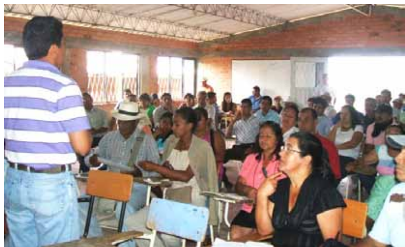
Ausbildungsseminare Rural, kolumbianische Massif